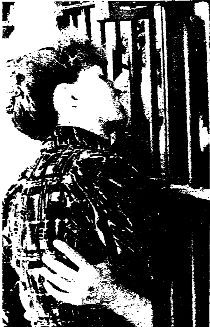
عراق مجنون يحطم قضبان السجن و... الجدران

ويضم فريق منظمة العفو التي تسعى الى التحقق من ادعاءات التعذيب اطباء تدريبوا على ايجاد دليل موضوعي على التعذيب.